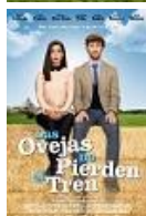
LAS OVEJAS NO PIERDEN EL TREN Director: Álvaro Fernández Armero Morena Films, Televisión Española y Canal + España