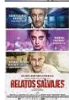
RELATOS SALVAJES Director: Damián Sziffrón El Deseo, S.A.(en coproducción)