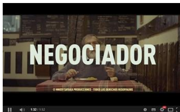
NEGOCIADOR , de Boria Cobeaga Producciones Aparte / Atresmedia Cine / Telefónica Studios