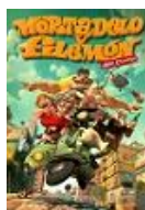
MORTADELO Y FILEMÓN CONTRA JIMMY EL CACHONDO Director: Javier Fesser Películas Pendelton (en coproducción)