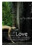
AUTOPSIA DE UN AMOR Director: Arturo Prins López Arturo Prins López