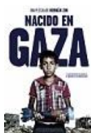
2014. NACIDO EN GAZA Director: Hernán Zin Contramedia Films (en coproducción)