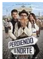
PERDIENDO EL NORTE Director: Nacho G. Velilla Atresmedia Cine, Aparte Producciones y Telefónica Studios