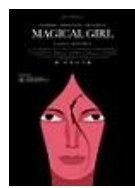
MAGICAL GIRL Director: Carlos Vermut Aquí y Allí Films y Canal + España