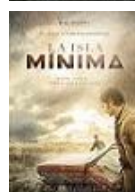
LA ISLA MÍNIMA Director: Alberto Rodríguez Atresmedia Cine y Atípica Films (en coproducción)