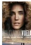
NO LLORES. VUELA Director: Claudia Llosa Wanda Vision (en coproducción)