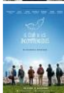
EL CLUB DE LOS INCOMPRENDIDOS Director: Carlos Sedes Bambu Producciones